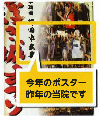
今年のポスター 昨年の当院です